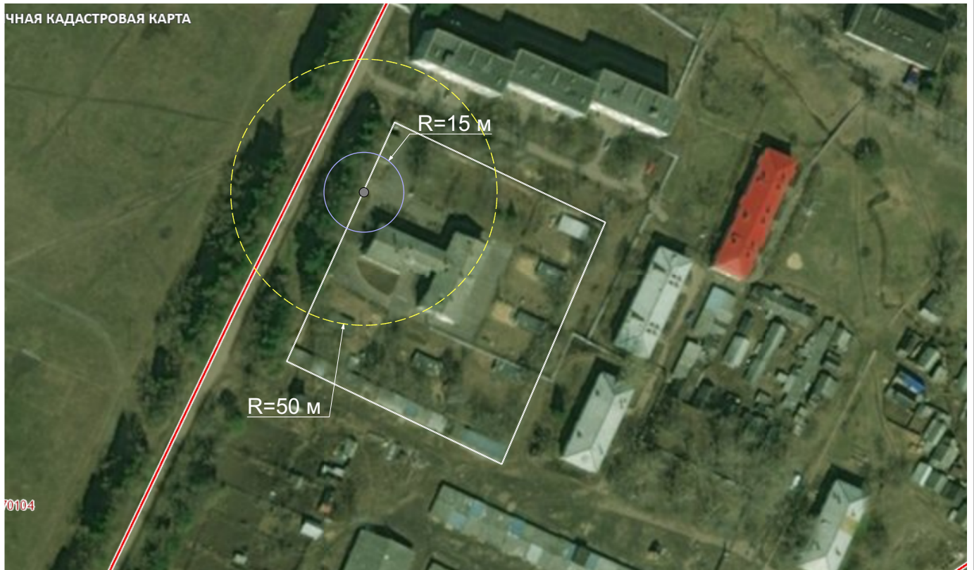
Схема границ прилегающих территорий М 1:2000